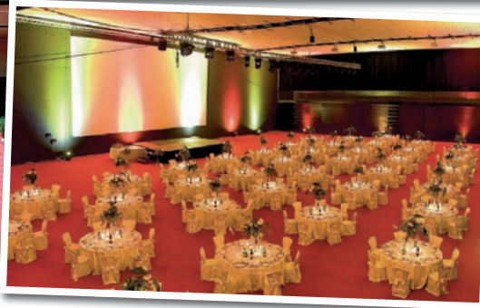
Anzahl der Plätze/Bestuhlung